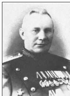
М. Ф. Королев